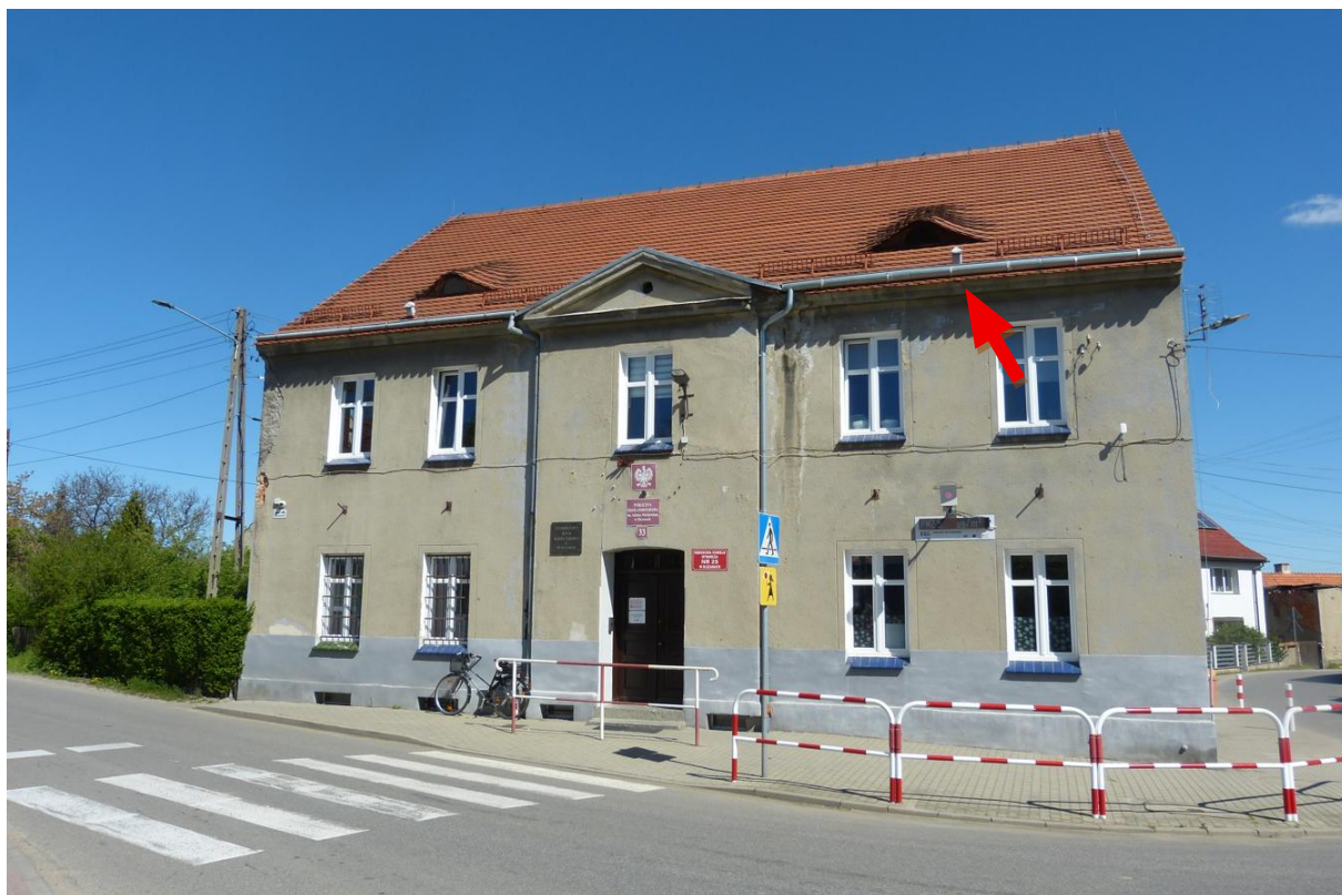
Fot. 1. Miejsce gniazdowania pary wróbli Passer domesticus w podmurówce dachu.